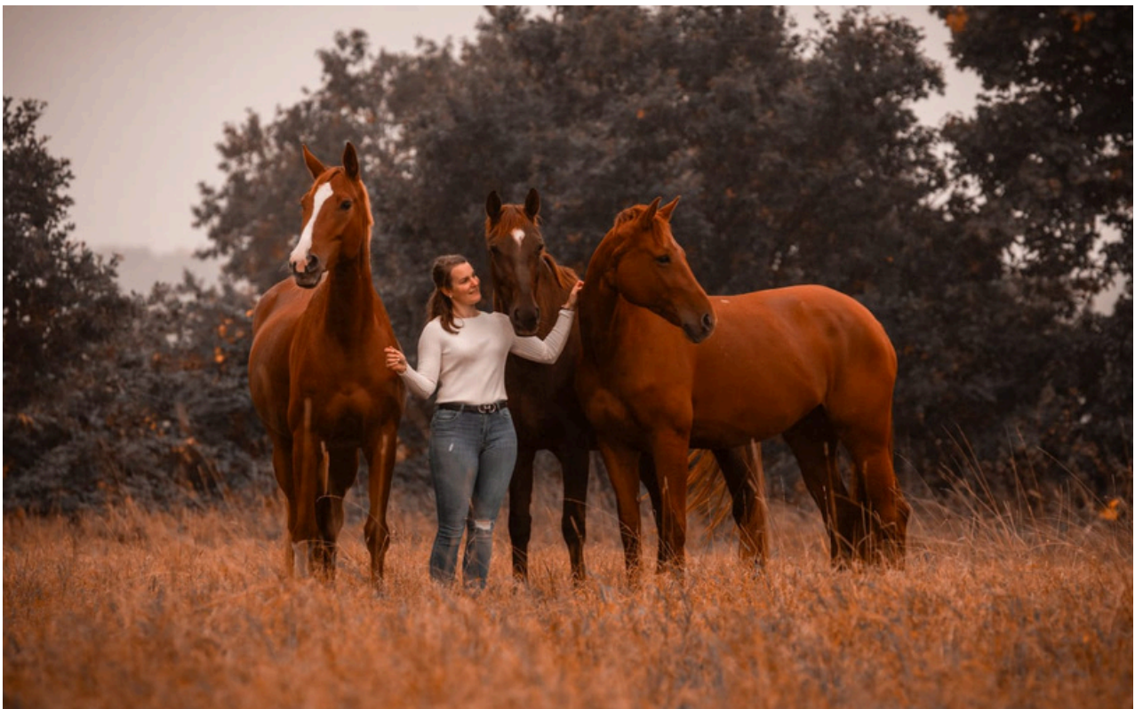
v.l.n.r. Be my Happiness, Descara de Luxe & Elfentanz

„Dressur ist für mich ein leiser Dialog – getragen von Vertrauen und Gefühl.“